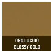
ORO LUCIDO GLOSSY GOLD