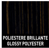
POLIESTERE BRILLANTE GLOSSY POLYESTER