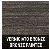
VERNICIATO BRONZO BRONZE PAINTED