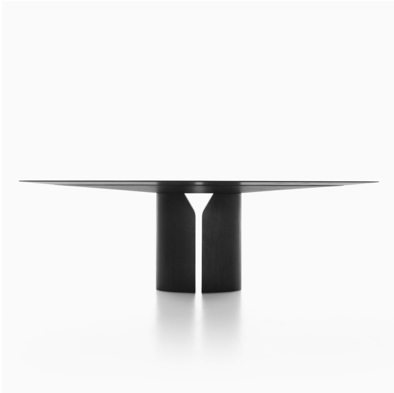
Tavolo ovale in marmo nero Ebano ricostruito. / Oval table in reconstructed black Ebony marble. L250 D130 H74