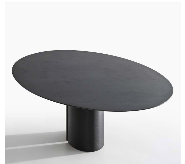
Marmo nero Ebano ricostruito. Reconstructed black Ebony marble.