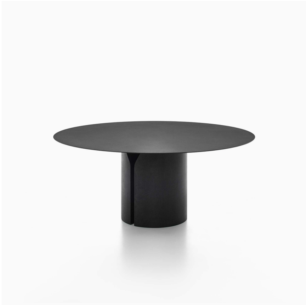
Tavolo tondo in marmo nero Ebano ricostruito. / Round table in reconstructed black Ebony marble. Ø180 H74