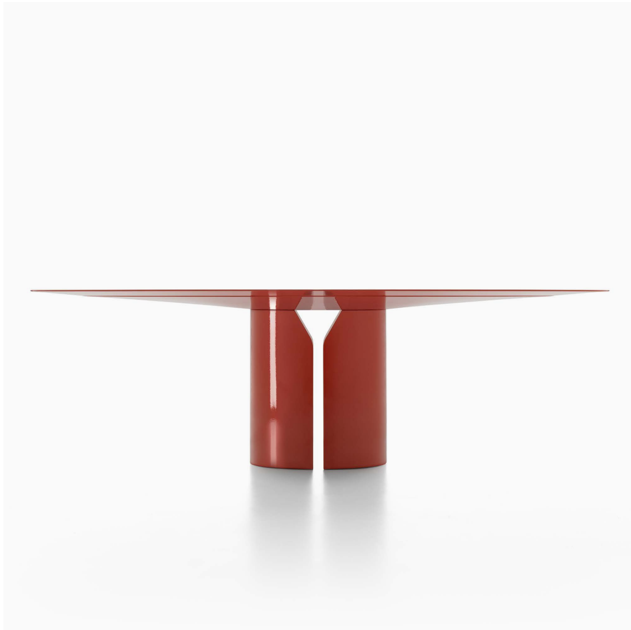
Tavolo ovale laccato lucido rosso corallo. / Gloss lacquered oval table in coral red finish. L250 D130 H74