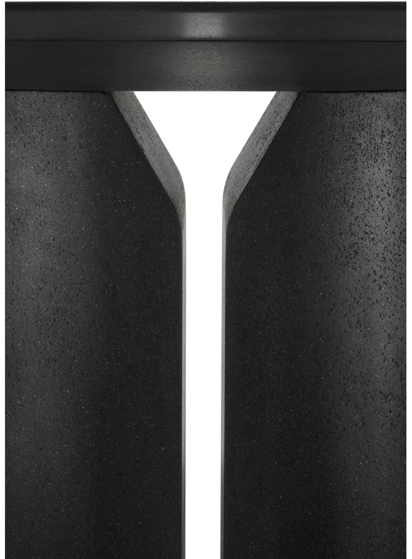
Due basi simmetriche a sostegno del top. / Two symmetrical bases that support the top.