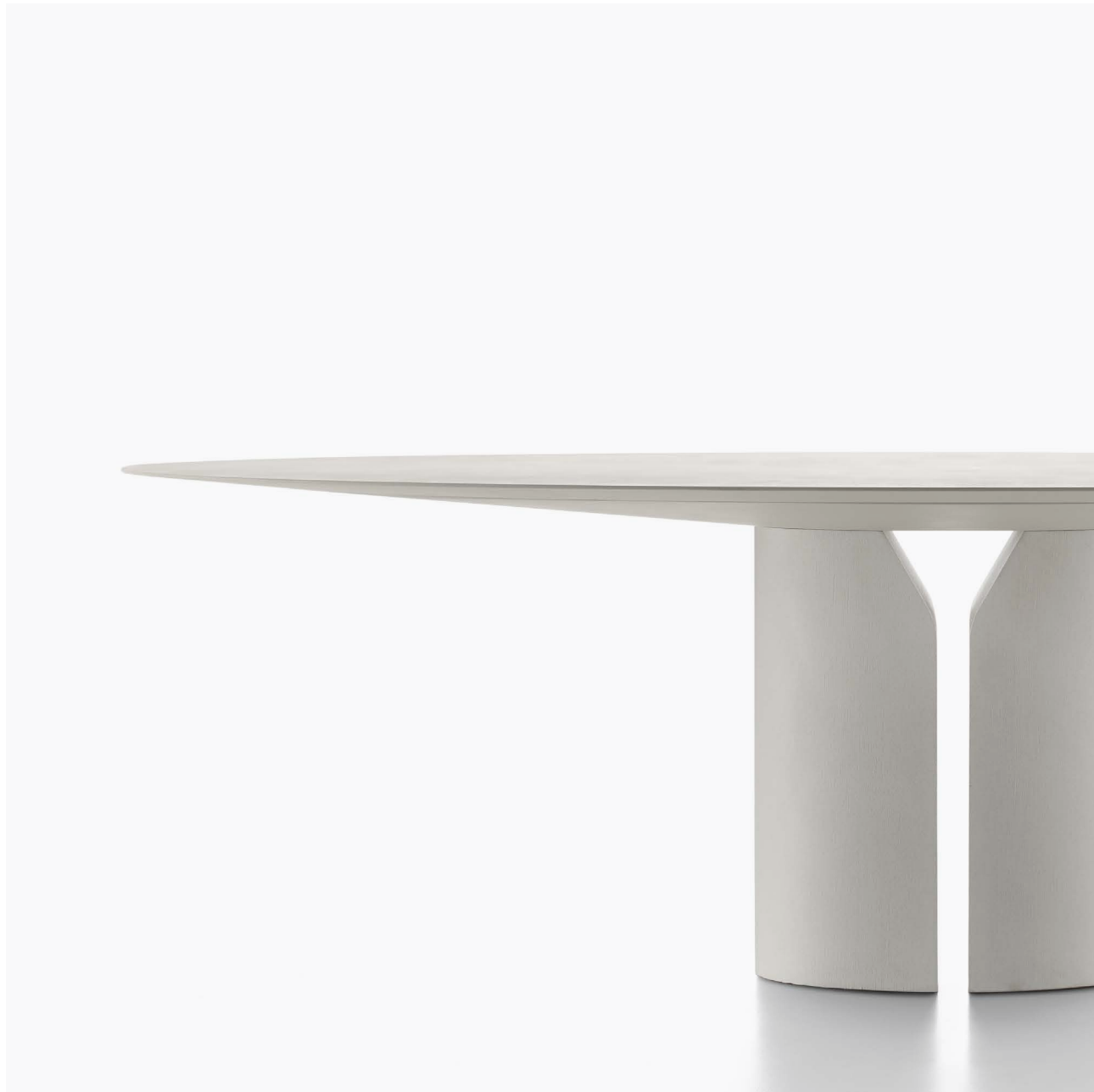
Tavolo rotondo in pietra ricostruita bianco calce X131 Round table in reconstructed stone white Calce X131 Ø180 H74