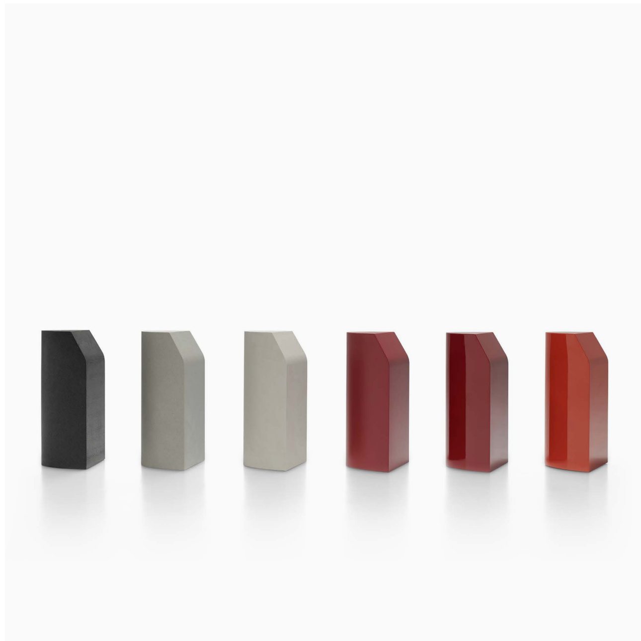
Tavoli monocromatici, laccati o rivestiti con l'applicazione di materiale in spessore di circa 3 mm. Monochromatic table, lacquered or faced with the application of 3 mm slabs.