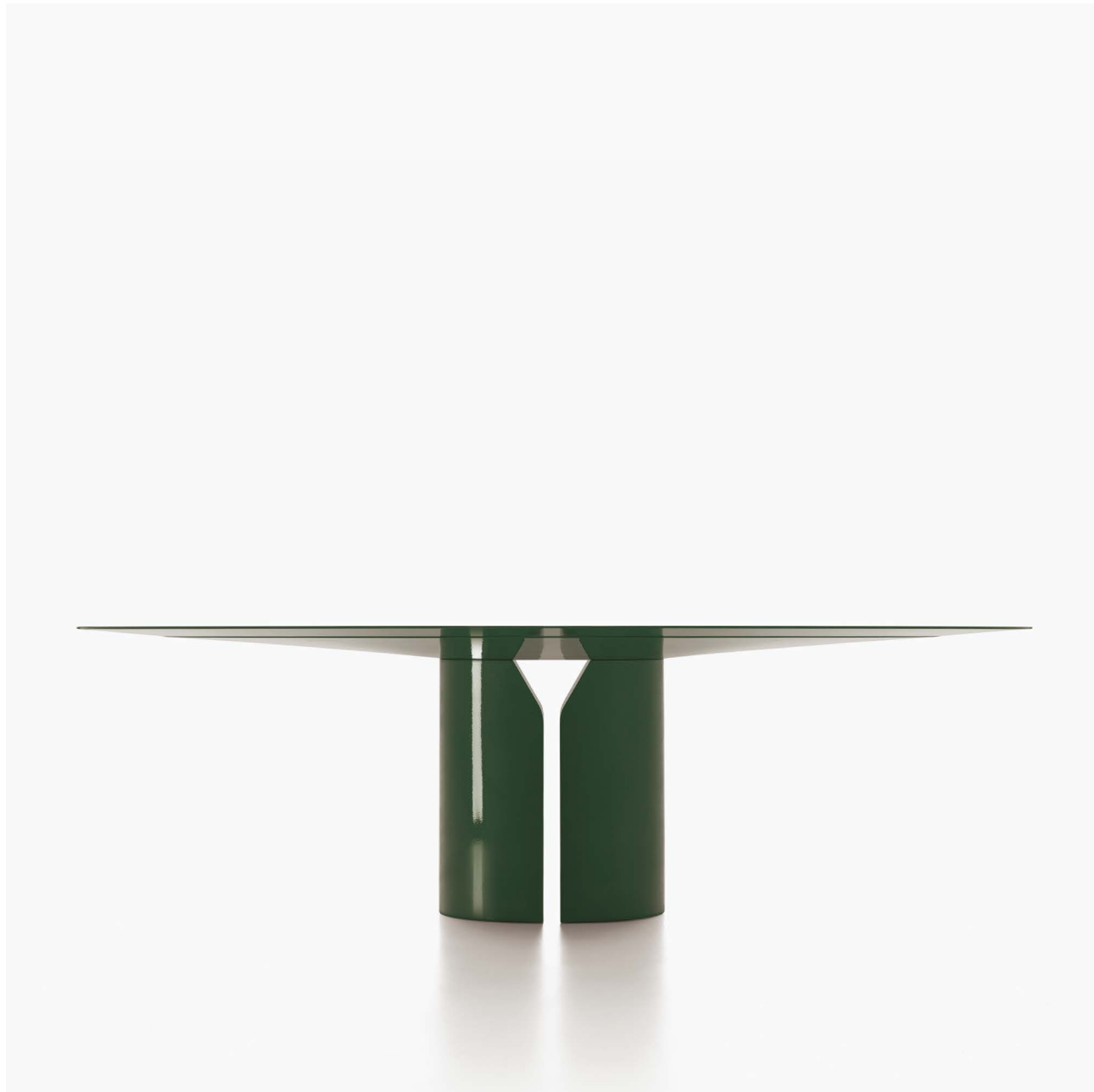
Tavolo ovale in laccato lucido verde scuro ral.6007 (special colour) / Oval table in matt lacquered dark green ral.6007 (special colour) L250 D130 H74